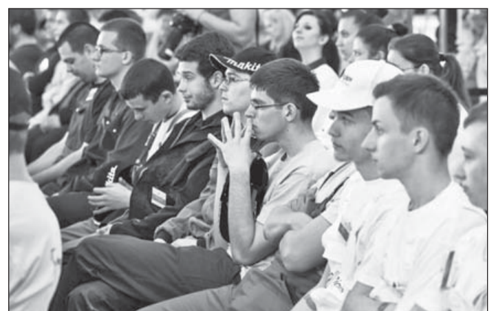
Érdeklődő fiatalok a fesztiválon

A Knauf folyamatosan keresi a kapcsolatokat az iskolákkal, azokkal az intézményekkel, amelyek hajlandók az új típusú tudást befogadni. Tapasztalataik szerint kevés a szakmai gyakorlati oktató, és ennek egyik oka, hogy a szakmák is változnak. Korábban például egy szakma volt a szárazépítő és a redőnyszerelő, ma már mindkettő önálló. A szárazépítő válaszfalakat, tűzvédelmi borításokat építenek, tetőterek beépítését végzik. A cég álláspontja szerint elegendő lenne, ha az országban összesen három helyen