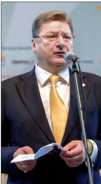
Parragh László, az MKIK elnöke

Negyven szakmában mérték össze tudásukat az ország legjobb szakmunkástanulói az idei Szakma Sztár Fesztivál keretében megrendezett Országos Szakmai Tanulmányi Verseny és a Szakma Kiváló Tanulója verseny döntőjén Budapesten. A Magyar Kereskedelmi és Iparkamara (MKIK) által immár kilencedik alkalommal szervezett rendezvényen a fiatalokat Parragh László, az MKIK elnöke és Cseresnyés Péter, munkaerőpiacért és képzésért felelős államtitkár köszöntötte. Az idén a határon túlról, a Felvidékről, a Vajdaságból és Kárpátaljáról ismét érkeztek versenyzők, akik kilenc szakmában vettek részt a megméretésen.