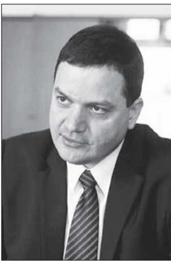
Odrobina László, az NGM szakképzésért és felnőttképzésért felelős helyettes államtitkára

ját. A kamara és a kormányzat közös erővel egy olyan szakképzési rendszer kialakításán dolgozik, amelyben mindenki nyertes lesz. Ennek egyik fontos lépése volt a szakképzési centrumok létrejötte, amelyek keretében a szakiskolák működnek, teret nyitva az új ötleteknek. A helyettes államtitkár példaként utalt a legutóbbi Szakmák Éjszakája című rendezvényre, amely hatalmas sikert aratott, hiszen négy óra alatt több mint negyvenezer látogatója volt. Mindez azt igazolja – emelte ki –, hogy a szakmák kezdik visszaszerezni régi presztízsiüket. Ezt szolgálja a következő, szeptemberben életbe lépő intézkedés is, amely új iskolatípusokat hozunk létre. Szakközépiskolák és szakgimnáziumok indulnak a korábbi szakiskolák és szakközépiskolák helyett, azzal a céllal, hogy a fiatalok az OKJ-s szakmunkás bizonyítvány után gyorsan felkészülhessenek az érettségire, illetve az érettségivel együtt szakmát is szerezzenek. Bejelentette azt is, hogy szintén szeptembertől a szakképzési centrumokban a végzett, 18 éven felüli, fiatal szakemberek ingyenesen tanul-